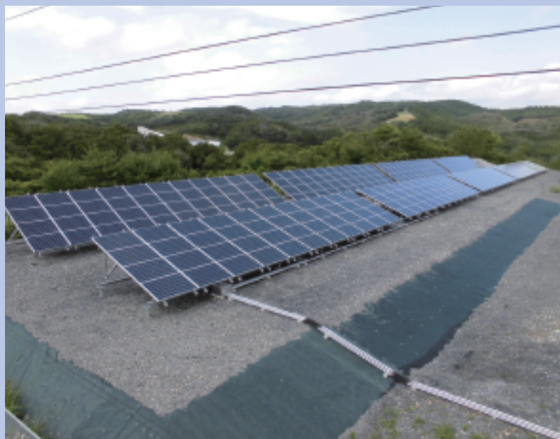
■宮城豊里工場 平成26年6月 売電開始