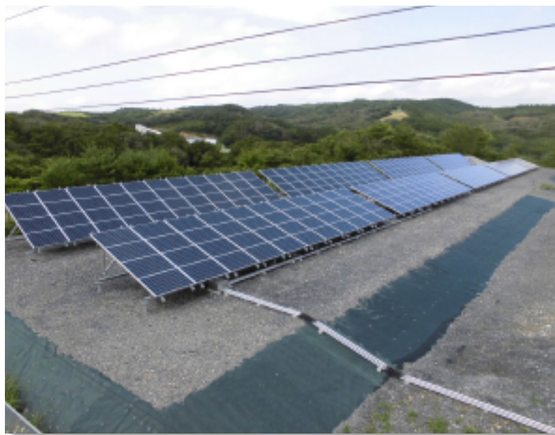
■ 宮城豊里工場 平成26年6月 売電開始